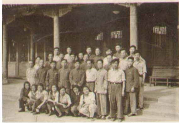
华北大学工学院师生合影

面临这个新的形势和任务，学院在总结解放区教育工作经验的基础上，吸收办学中有用的经验，特别是借鉴苏联教育建设的先进经验，联系新中国的实际，制定了华大工学院办学的方针。