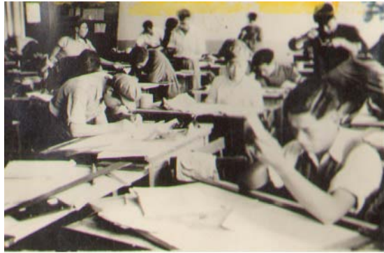
华北大学工学院的学生在制图

第一，关于学习。 1948年7月，曾毅在北方大学工学院全体会议上作了关于学习问题的报告。他在报告中首先提出一个革命者和革命干部必须具备的条件以及如何进行政治学习等问题，特别强调了要读书，要系统学习政治理论，同时也应学习文化知识。他说：“革命在全国胜利以后，是要搞