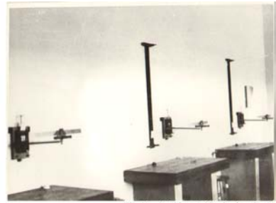
华北大学工学院实验室

业教育的费用，其中大部分用在华大工学院。这充分说明党和国家对建设新型重工业大学的高度重视。第三，大力建设新的实验室，如新建的热工实验室、电机实验室、金相与热处理实验室、材料实验室等，在当时工科院校中具有自己的特色。到 1952 年，华大工学院固定资产增加到 553 万元。