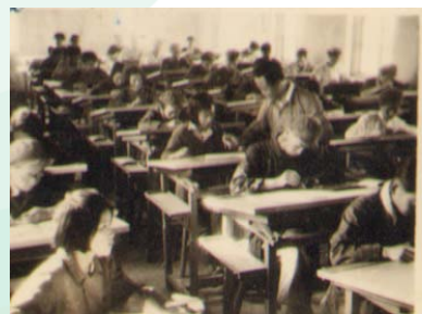
华北大学工学院学生在上制图课

第三，关于“通才与专才结合”的原则。 曾毅主张一个好的专家，“必须有广泛科学理论知识，同时要在这个基础上成为特定技术方面的专家”。没有“博”的基础就不可能有“高”的专家，因为自然现象是互相联系的，解决任何一个专门问题常常牵连到很多别的问题。为此，华大工学院的培养目标“既重视基础科学理论的系统学习，