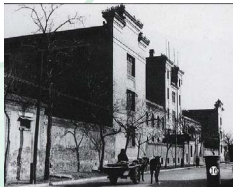
华北大学工学黄城根旧址

新中国成立前后，解放区大批机关、单位进京，中央和北京市机 关陆续建立，因而用房十分紧张。华大工学院进京最初阶段借用了 原中法大学在南锣鼓巷的校舍和各处租用的平房上课，仅有校舍 168 间，约 2 400 平方米。1949 年 12 月，学校购置民房，加上重工业部 暂时拨借的房舍，增到 388 间约 5 800 平方米，学校迁