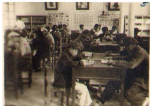
华北大学工学院的同学在图书馆自习