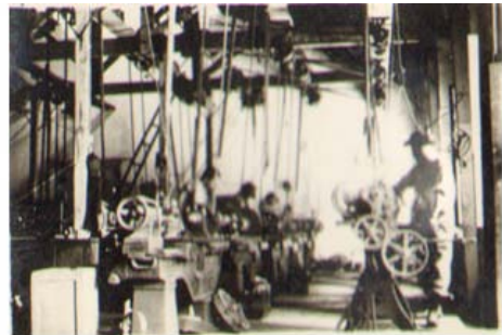
华北大学工学院实习工厂（南门仓）

在办学过程中，学院重视实践，重视学术。学院认为：培养工程技术干部，实践教学是整个教学过程中的重要环节，必须十分重视图书馆和实验室、实习基地的建设。