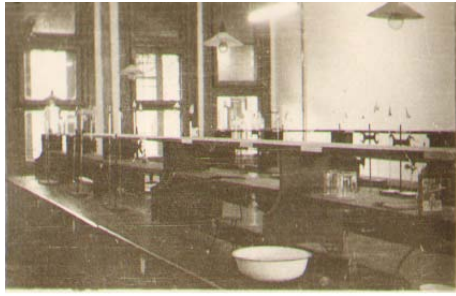
华北大学工学院化学实验室

后，经中央财经委员会批准，华大工学院设立了学制为五年的 7 个本科系，并于 1950 年暑假招生。这 7 个本科系是：机器制造工程学系、内燃机工程学系、航空工程学系、汽车工程学系、