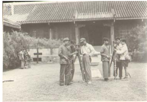
华北大学工学院学生在测量

技术管理为中心”。在设计方面，要以“工具机设计为重点，高年级分工具机设计组、生产工程组以及铸造、锻造或热处理等工程组”。这不仅适应机器制造工业的需要，也反映机器制造工业的生产发展水平。为了达到第二个目的，曾毅强调要采取