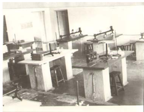
华北大学工学院实验室

程内容，还要十分重视工厂实习、科学实验、工程设计等实践环节，以培养学生运用所学理论解决实际问题的能力，去促进工业的发展与生产的提高。