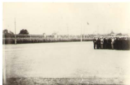
华北大学工学院师生参加开国大典