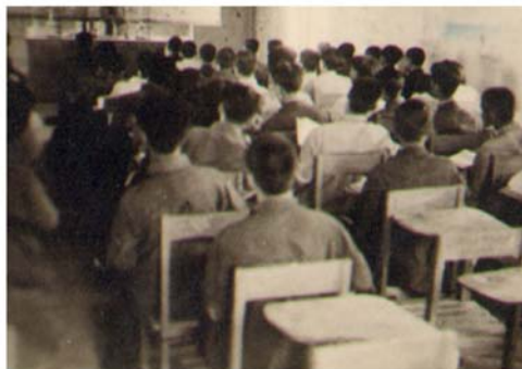
华北大学工学院的学生在上课

中法大学的并入有效地缓解了学院迁入北平后缺乏校舍、实验室、图书馆等困难,显著增强了华北大学工学院的办学实力。一些教师的