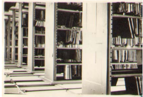
华大工学院图书馆书库

1950年9月,中法大学校本部和数理化三系并入华北大学工学院。其他系科并入北京大学、南开大学等校。中法大学的校舍、实验室、礼堂、图书馆、仪器设备等设施归华北大学工学院使用。当时中法大学有111名学生,教师18人(教授10人),职员25人,工友25人,教辅人员3人同时并入。