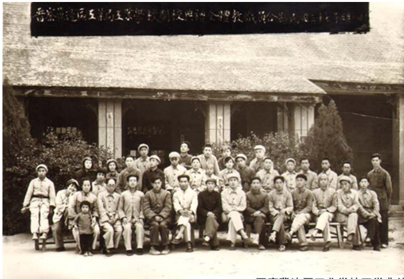
晋察冀边区工业学校开学典礼

1947年底，晋察冀工业交通学院的预科班搬到河北井陘，设机电、化工、工厂管理等学科。后改名晋察冀边区工业学校。任命王甲纲为校长。