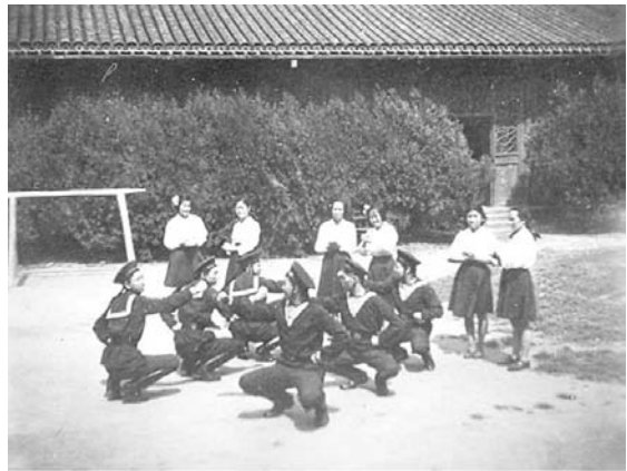
华北大学工学院学生进行文体活动

第一，把教师政治学习、思想改造与端正办学思想结合起来。 1951年，经马寅初发起，在京津地区高校中开展了以推动知识分子的思想进步，改造高等教育为目的的知识分子思想改造运动。曾毅于同年4月代表学院在全体教师大会上作了关于学习问题的报告。根据当时的形势，学院把学习政治的重点放在反对美帝国主义侵略上，克服一定程度上存在的“崇美、亲美、恐美”思想，以实际行动