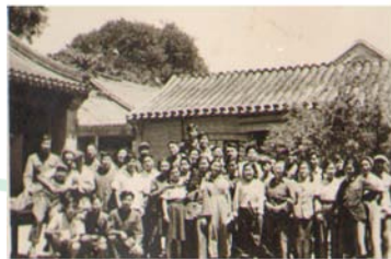
华北大学工学院俄文专修班一、二、三班同学的合影

华大工学院进入北平前主要是为解放战争服务，所设置的机械、机电、化工、土木、冶金等班级，都是按当时军工生产所需要而设置的，谈不上正规化的科