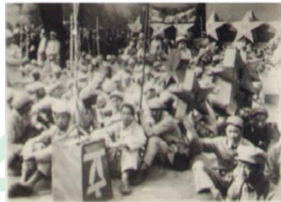
一九四六年张家口市晋察冀工专学生参加市议员选举

学校设立数学、物理、化学、英语、绘图、工程常识、外语、社会知识等课程。此时，全校学生 200 人，教职工共 76 人。