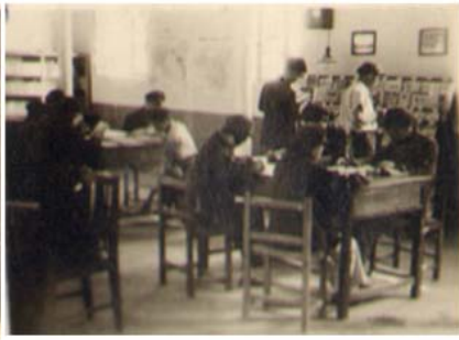
华大工学院（井陘时期）图书馆阅览室