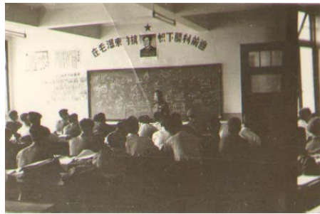
华北大工学院教室

第一，我们的教育方针是教人而不是教书。 教授是根据学生的程度和以后的需要编讲义，调整进度。在曾毅的倡导下，在华大工学院教师中形成一种共识，就是以“教人”为任务，而不仅是“教书”为任务。“教书”只是把书本知识课堂上讲授完成，是否合乎学生情况，是否能被学生接受，教师是不必关心的；而“教人”是使所教课程为学生所掌握，并能使学生从所学的理论解决实际问题，从实践的经验做理论的推广。