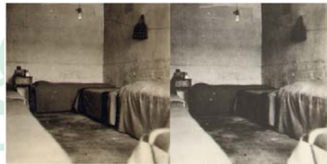
1948年华大学生宿舍（井陘时期）

这一时期是我国解放战争取得了决定性胜利，新中国成立的历史重大转折时期，也是我校历史上的重要转变时期。华北大学工学院的创建标志着我校办学逐步走向正规。