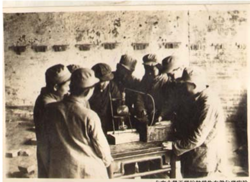
北方大学工学院的学生在做化学实验

有理化实验室，能做 18 个化学实验、10 个物理实验。建有实习工厂，可制作和生产甘油、香皂、煤油、黑漆等。在专业教育上贯彻“少而精”的