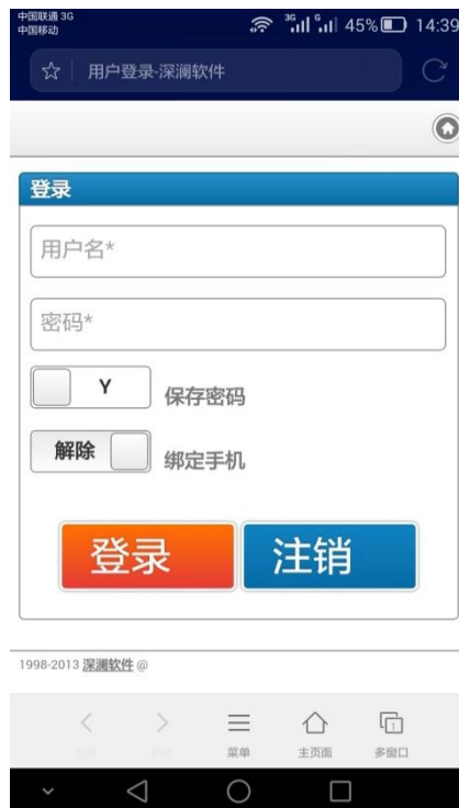
图 4 移动设备连接 BIT 校园无线网

使用手机或其他移动设备连接 BIT 时，成功后会自动弹出登录页面，如图 4 所示。输入上网账号和密码，点击登录即可。此次登录将直接连接到互联网。