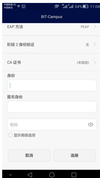
图 5 安卓系统使用 BIT-Campus 登录

请根据图 4 显示的情况填写信息，其中“身份”填写上网账号用户名，“密码”填写上网密码，EAP 方法选 PEAP，阶段 2 身份验证为无，匿名身份留空。输入完成后点连接即可登录网络。此次登录也是直接连接到互联网。