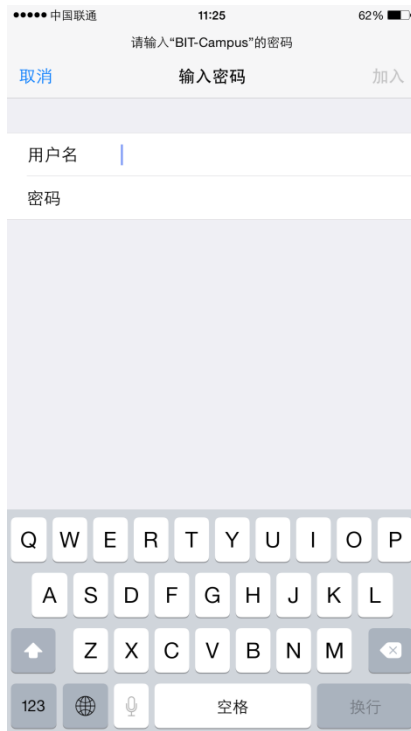
图 6 苹果系统登录 BIT-Campus 校园无线