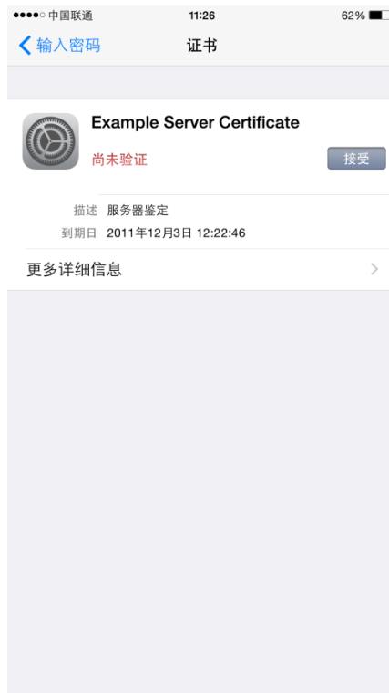
图 7 苹果系统登录 BIT-Campus 校园无线时接受证书