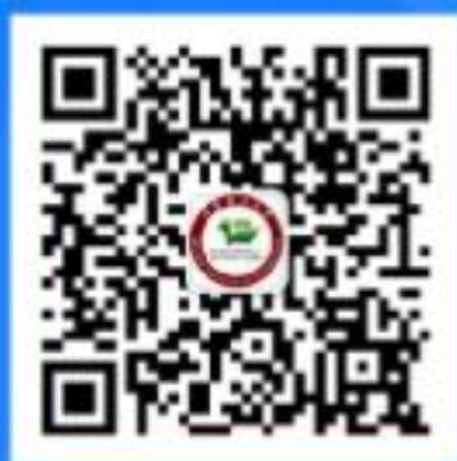
中心微信公众号二维码

会议期间有关信息将在北京理工大学教学促进与教师发展中心 微信公众号发布，敬请关注微信公众号:cfd-bit