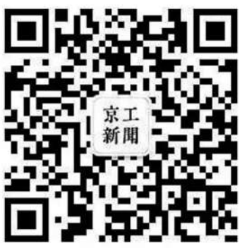
更多资讯请关注京工新闻社微信公众号

初夏的北理工,是妍丽而又动人的。色彩缤纷,相映更是极美。天空、夕阳、绿草、鲜花、晚霞、霓虹,颜色在白昼与夜晚的变幻间穿行,绘成一幅生机勃勃的初夏画卷。 白天的色彩被植物支配。那最耀眼的一抹属于花,纤紫,橘黄,浅红,点点色彩连接成线,再汇聚成面,一片绮丽的花海就此浮现,远看似天边虹霞般明妍,近赏又有暗香萦绕,妙不可言。 翠绿则是花红的背景,那绿色绿得纯粹,绿得出尘,满含生命的朝气与坚强。清晨时分,露水在草的顶尖凝结,映着天边第一抹朝阳,透射出生命的色彩,让人精力充沛,坦然面对这一天的欢喜疲惫。 暮色或许是校园中最惊艳的一瞥。落日西沉,向世界散射余晖,直至最后一角消失在地平线。夜色降临,灯亮了,柔和的灯光与残存的夕阳,在空中完美地结合了,没有一丝突兀,在校园中奏起了一段光与影的圆舞曲。人群络绎,穿行于朦胧色彩之间,竟无形 中有别样的美感。 色彩交汇,在初夏的校园中绽放,编制出一个个美丽的故事,谱写出一首首动人的歌谣。 (文章来源:京工新闻社微信公众号 文/易宇轩)