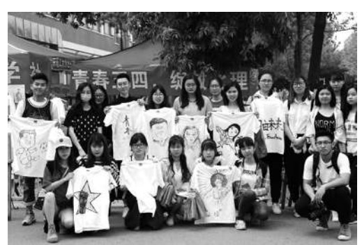
5月3日，设计与艺术学院在良乡校区举办“五四”手绘T恤活动，同学们挥毫泼墨，勾勒出丰

4月28日，纪念五四运动98周年暨青年“双创”成果展示交流活动在廊坊市举办。我校三项作品参与本次活动。活动中，北京理工大学团委与廊坊市团市委签署了《青年创新创业区域交流合作项目协议书》，就服务青年创新创业达成深度合作意向。廊坊与京津区域协同创新共同体的构建搭建了青年创新创业对接交流平台，促进了区域创新知识的流动、创业资源的共享，为我校创新创业青年带来了抢抓京津冀协同发展发展机遇的新契机。