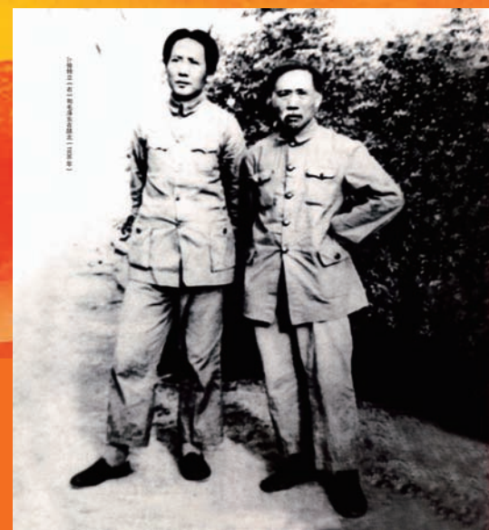
与毛泽东同志合影(1936年,陕北)

【编者按】徐特立同志是我国杰出的无产阶级革命家、教育家,是我校延安建校时期自然科学院的主要创建者,徐特立教育思想已成为我校宝贵的精神文化财富,时至今日仍有十分重要的现实意义。为了更好地弘扬徐特立老院长崇高的精神和教育思想,本报将连载《我们的老院长徐特立》一书,以供广大师生员工学习研究。