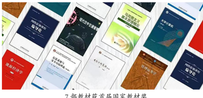
7部教材获首届国家教材奖

2023年7月，学校获批教育部首批“国优计划”试点建设高校，秉承“强理工、重教育、强交叉、重协同、强知识、重素质”的培养理念。